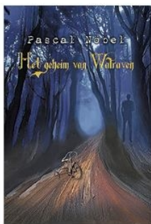
Cover van het boek.