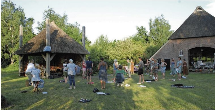
Repetitie van Popkoor Backcorner in de tuin van een van de leden.

ZUTPHEN/WARNVELD - Popkoor Backcorner is een gemengd koor uit Zutphen/Warnsveld met ongeveer 50 leden. Lange tijd zaten de leden voor de wekelijkse repetities op donderdagavond achter het scherm thuis via Zoom mee te zingen. Het haalt het niet bij het met elkaar werkelijk samen zingen. Toch is het een manier gebleken om als koor te blijven bestaan en de verbinding te houden. De