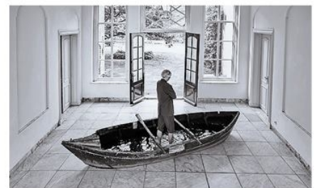
Fotografie: Crystal Park - Meike Lammes en Gerbrand Pot

Natuurlijk hebben we nog de kermis, de Hanzehof, de markt en de torens. Maar als we dit schip laten zinken, dan is Zutphen haar ziel verloren.